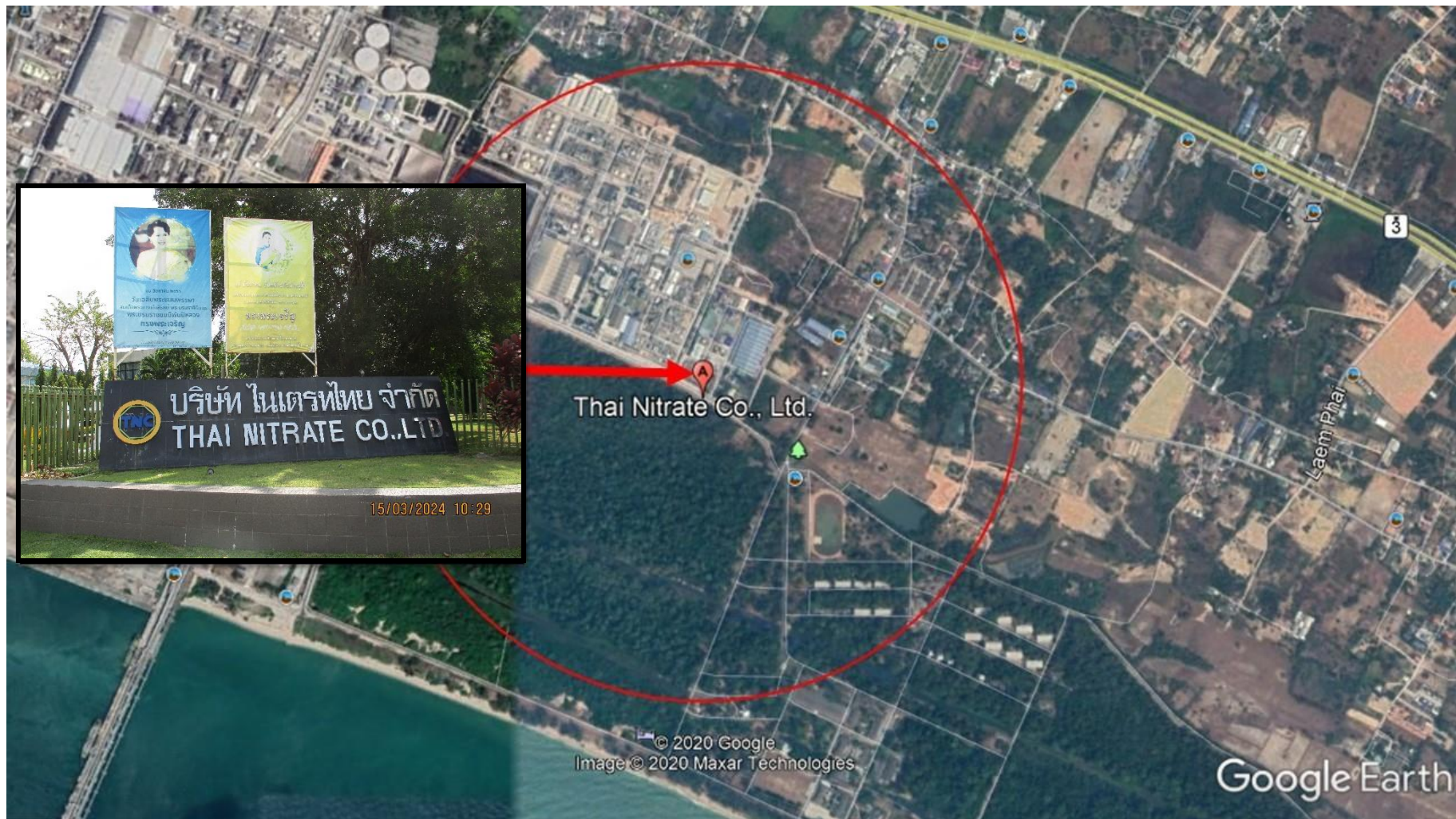
รูปที่ 1.2-1 แผนที่แสดงที่ตั้งโครงการ